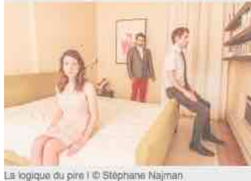
La logique du pire

2Fik court la chasse-galerie | 2Fik, Montréal. 28 + 29 + 30 mai. Place des Festivals/Quartier des spectacles. Trois jours durant, 2Fik transforme la place des Festivals en un vaste studio de photographie à ciel ouvert et recompose la mythique Chasse-galerie avec sa galerie de personnages colorés. Kitsch, queer, trad.