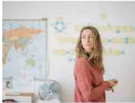
J'aime Hydro

Siri | Maxime Carbonneau, Montréal. 1 + 2 + 3 juin. Théâtre Prospero. Voici Siri, l'assistante vocale personnelle intégrée dans tous les iPhone. Actrice de poche redoutablement intelligente, n'aurait-elle besoin que du théâtre pour s'incarner?