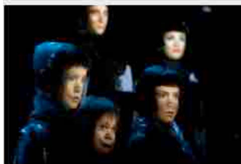
L'Autre hiver