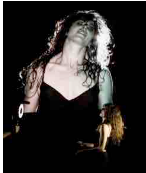
The Black Piece

Con grazia | Martin Messier + Anne Thériault, Montréal. 1 + 2 + 3 juin. Espace Libre. Martin Messier et Anne Thériault sont les détonateurs vivants d'un opus sous tension dédié à la démolition des objets. Une ode inquiétante à l'agonie du monde matériel.