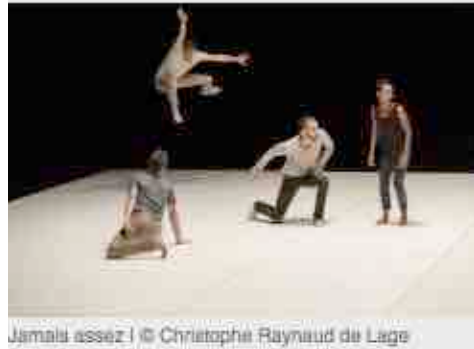
Jamais assez