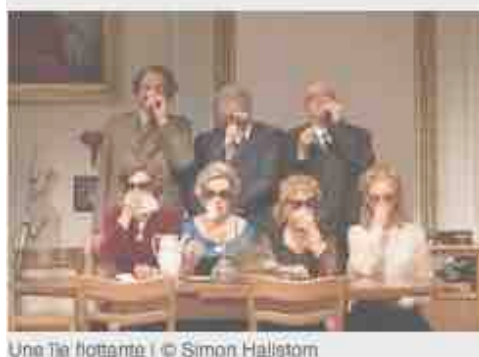
Une île flottante

Monument-National/Salle Ludger-Duvernay. Ode à la spontanéité et à la différence, Gala célèbre une danse décomplexée, imparfaite et jubilatoire. Un tour de force, profondément radical et féroce divertissant.