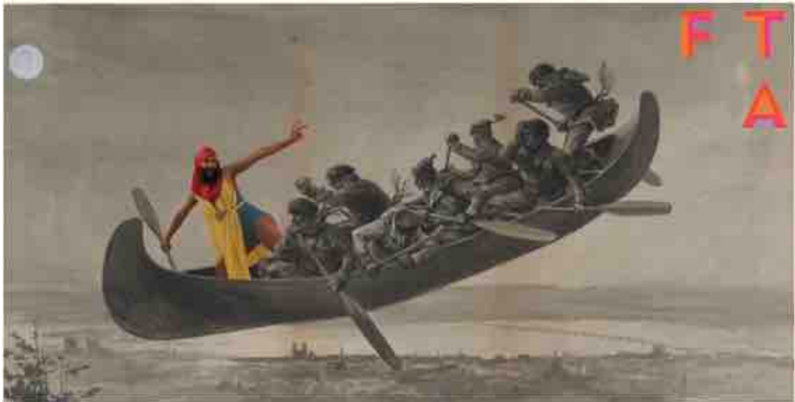
Image de 2Fik pour le FTA d'après le tableau La Chasse-galerie d'Henri-Julien (MNBAQ)

Festival TransAmériques du 28 mai au 6 juin – Programmation sur fta.ca