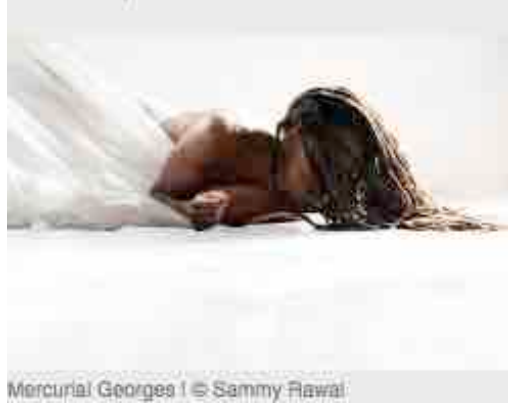
Mercurial Georges | © Sammy Rawai

The Black Piece | Ann Van den Broek, Anvers + La Haye. 27 + 28 mai. Usine C. Entre obscurité absolue et lumière crue, Ann Van den Broek orchestre un périple chorégraphique aux allures de film noir. Une aventure sensorielle extrême. Brillant.