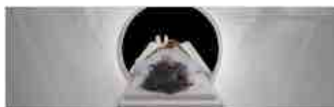
Go Down, Moses

26 + 27 + 28 mai. Place des Arts/Théâtre Jean-Duceppe. Un vaudeville totalement décalé où le kitsch côtoie le sublime. Une rare occasion de découvrir un maître européen dont l'œuvre colossale détraque le théâtre pour le rapprocher de la vie.