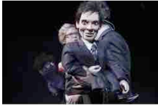
The Ventriloquists Convention